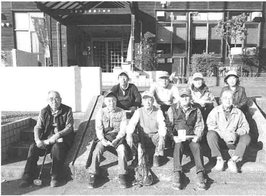
(優勝した後山チーム)

第13回グラウンドゴルフ大会は昨年10月29日、筒瀬小グラウンドで41名参加のもと開催されました。秋晴れの暖かい気候で熱中症が心配される中で、皆さんコロナマナーに留意してプレーを楽しまれました。