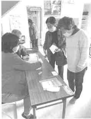
受付の様子 いきいきポイントの対象です!

「いきいき百歳体操」は日常生活に必要な筋力を高め、健康維持を目指しています。イスに座っての体操が中心で、広島東洋カープの応援歌に合わせて、楽しく体操ができます。