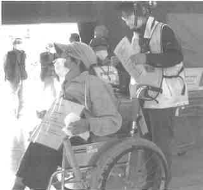
車イスの方の避難誘導

さらに、広島工業大学と連携し、避難者の健康管理に「スマートウォッチを活用する。」「受付時の音声認識装置」など先端技術を活用した実験も行いました。また、災害時の要支援者避難支援体制の強化として「安否確認システム」の説明も行いました。