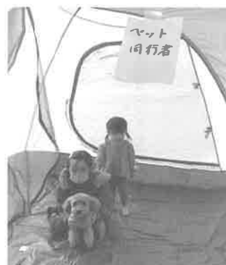
ペット同伴の方は テントへ避難誘導