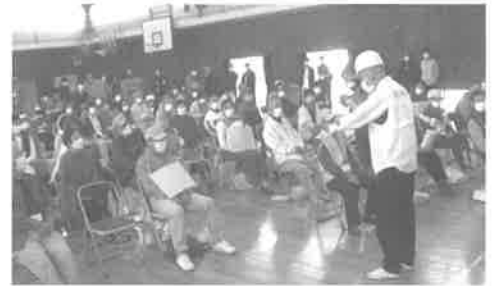
訓練内容を説明する 柳迫自主防災会連合会会長

「赤ちゃんを連れて避難してきたが皆さんに迷惑がかかるのが心配です。」「深川学区の住民ですが、落合小学校へ避難しても良いですか?」さらには「避難途中で転倒しケガをしてしまいました。応急手当をしてもらえますか?」「犬を連れてきましたが、大丈夫ですか?」などへの対応を自主防災会役員が行いました。