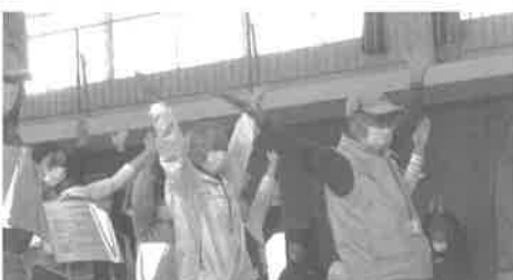
血栓予防体操をする避難者