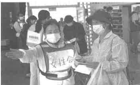
女性会も避難者誘導の お世話をしてくださいました