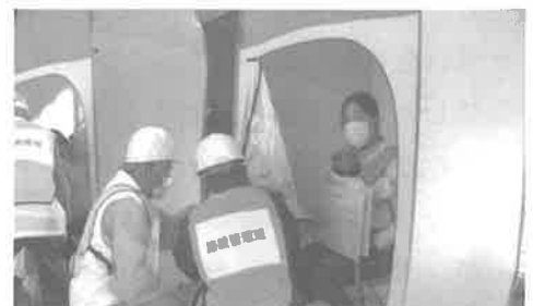
プライベートテント内の 避難者の健康チェック