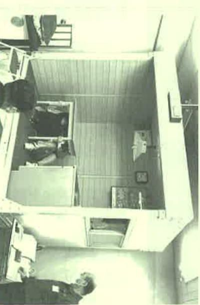
震度6弱の横揺れ体験。テーブルの下に身を隠します。

日常からの災害想定準備が大切なことです。想定訓練で、火を消すことが、非、機会を作って、広島市総合防災センターで被災想定体験を受けられることをお勧めします。詳しくは、(電話)082-84310918まで。(山根)