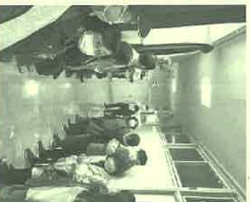
この通路を煙中体験しました。

実地体験の一つは、煙中避難体験でした。煙が充満した約15mの廊下を避難口まで脱出します。煙の中の中、前が見えない中、左手で壁を触りながら背を低くし、ハンカチで口を覆い脱出。からは、「先が全体験後、参加者から、「先が全く見えず恐怖を感じた」「すぐに出れると考えていたが、15mが、こんなに長く感じた」とは、想定外だった」と述べられています。講師からは、「自分の頭で判断して下さい。」と指