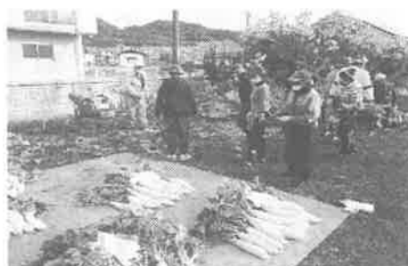
大根を収穫して一人暮らし高齢者にお届けします