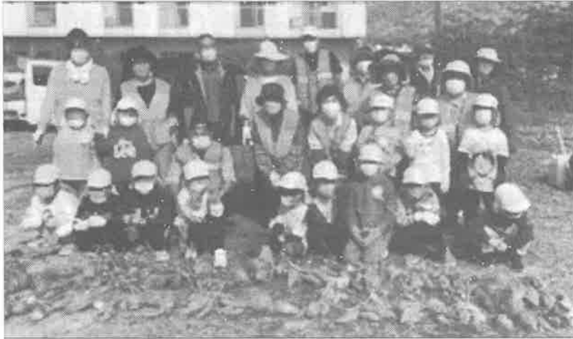
亀山南保育園をお招きしてさつまいも収穫