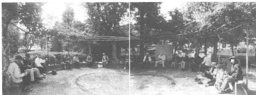
18人が自慢の弁当で昼食