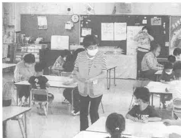
亀山南保育園での平和学習 みんなで鶴を折ります