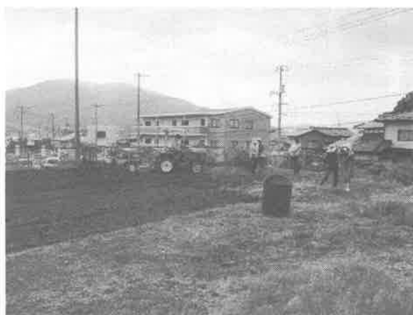
畑作り まずは草取りと畝作り