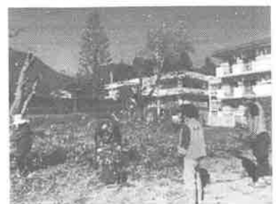
今年は社協ハウス前の庭木を伐採しました。