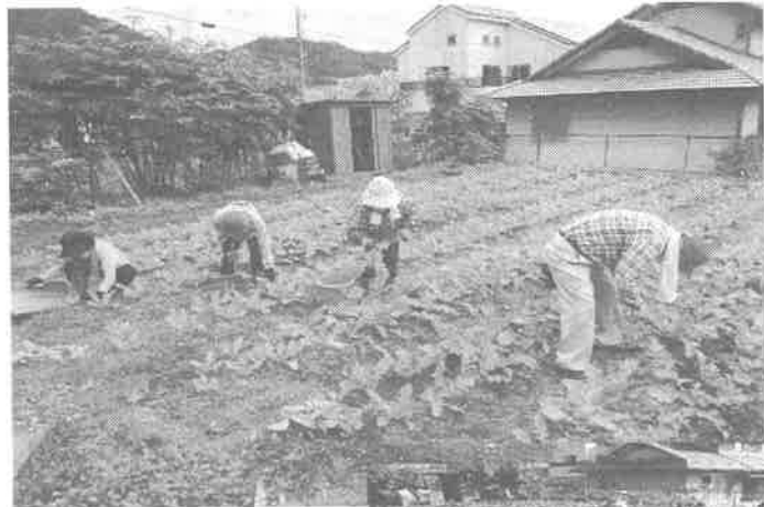
草取りと大根間引き