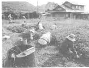
さつまいも草取り