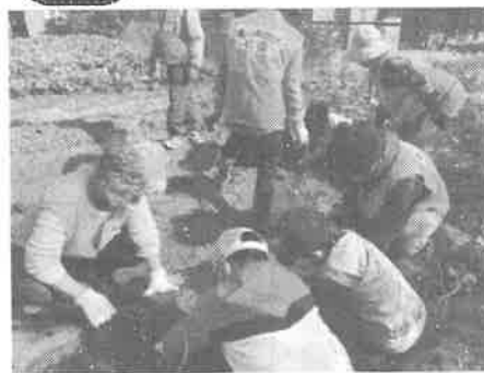
亀山南児童館さつまいも収穫