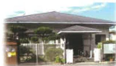
会場・上原北集会所