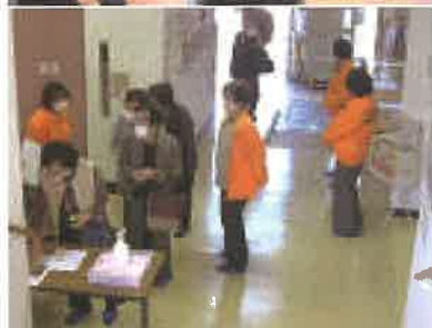
1階で手指消毒と受付