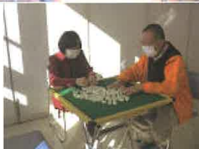
健康麻雀。講師とマンツーマン！