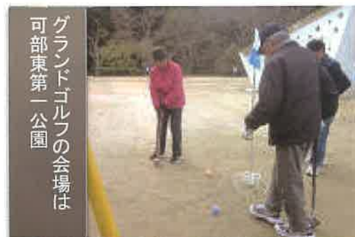
グランドゴルフの会場は 可部東第一公園