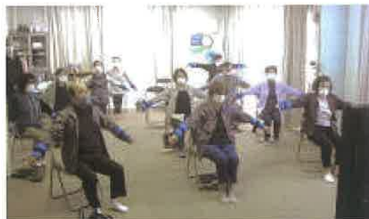
密を避けて2組に分かれて実施中！