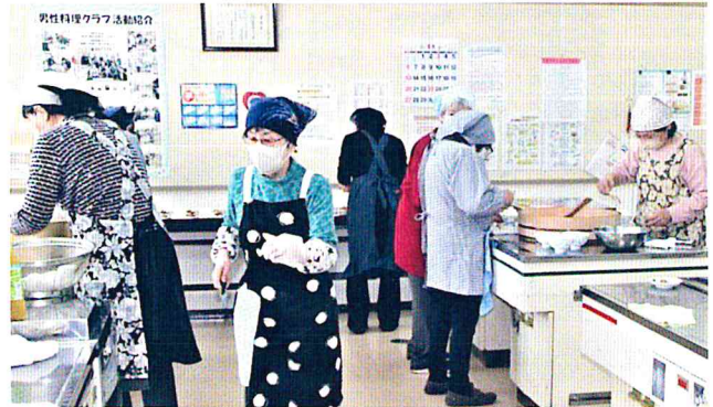
お弁当づくりの真っ最中(中央公民館)

現在29世帯(34人)の方の配膳・配食に、調理 18, 配食12人のボランティアのみなさんが活動 されています。(上)