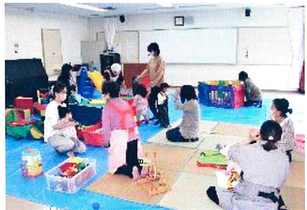
五日市中央公民館 2階