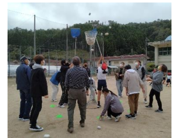
大人対児童のおじゃま玉入れ