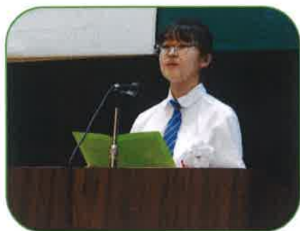
お祝いのことば 中学生