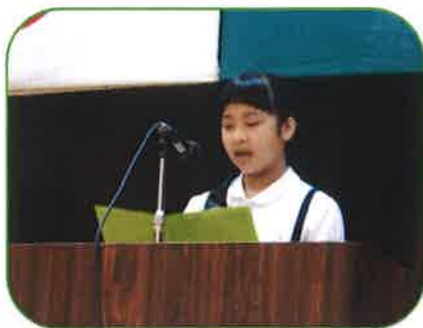
お祝いのことば 小学生