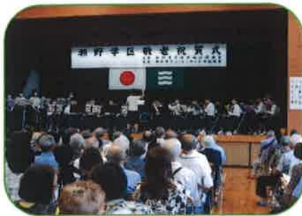
瀬野川東中学校 音楽隊