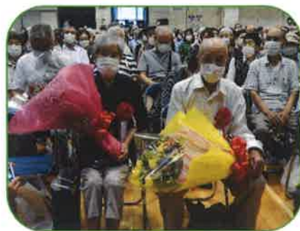
最高齢者 花束贈呈