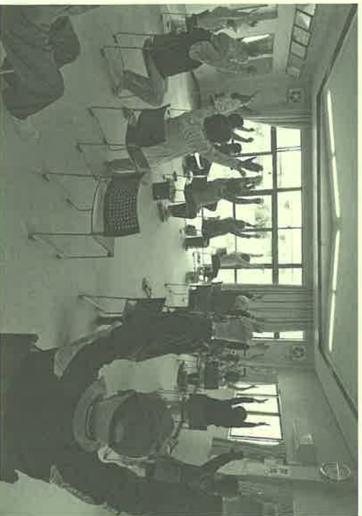
口田南集会所での百歳体操

コロナ感染を防ぐため、参加者の間隔を十分とるディスプレイに配慮するなど、徹底をはかったため2回の開催となりました。もちろんコロナ対策、手の消毒は言うまでもありません。健康維持に役立つ手軽な運動として、多くの参加者に利用して頂いております。参加者希望者は、安心してお申込み下さい。