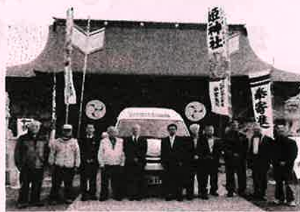
平成29年4月 安全運行と事業継続を 願い瀬保姫神社でお祓いを受けました