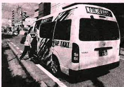
平成29年4月から、循環バス「こがね」の車両が新しくなりました