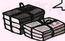
新聞紙・チラシ・雑誌