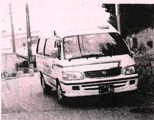
平成21年、運行開始当時の車両