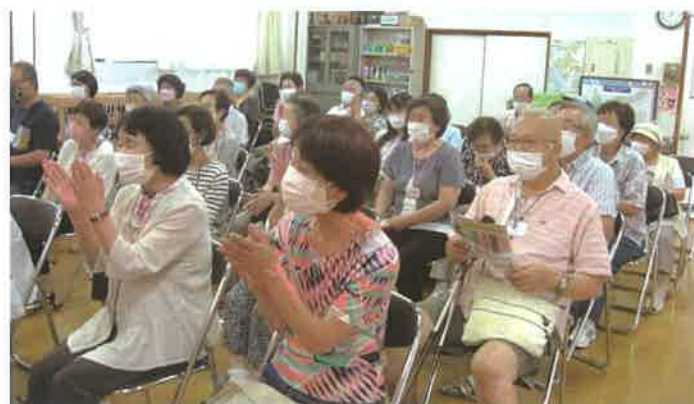
拍手と笑顔いっぱいの会場