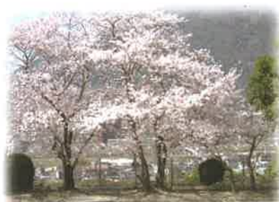
サロンの名前の由来となる 第二公園の満開のさくら