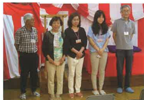
サロンの運営を支えている福祉委員の皆さん