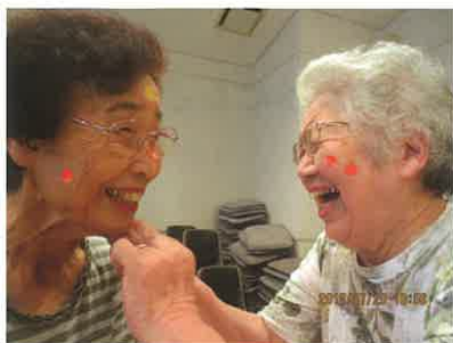
つながりを絶やさない地域づくりに！