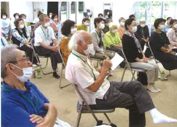
健康講座に聞き入る参加者

今後は、月一回・毎月第一土曜日10時(受付9時30分)の予定で開催する。薬剤師、地域包括支援センター職員、看護師による医療・介護相談コーナーを設ける。参加自由。