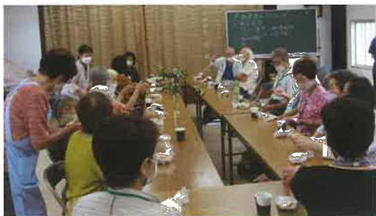
チャット一服「ティー? or コーヒー?」