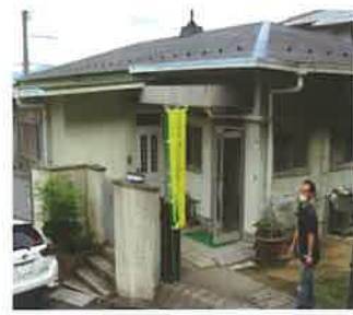
会場・第二東亜ハイツ集会所 いきいきサロン開催日の 目印は黄色ののぼり