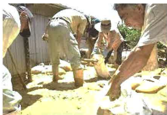
災害ボランティアセンターの運営に！