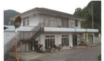
可部南集会所(可部東二丁目)