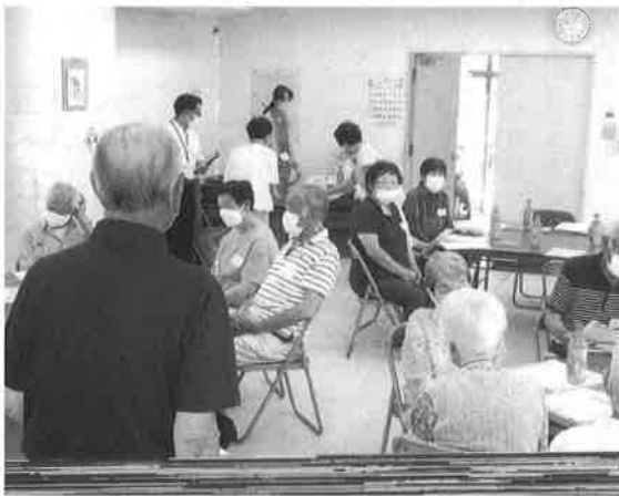
◎「見守りネット長東西」見守り協力員対象の情報交換会 7月11日(月)