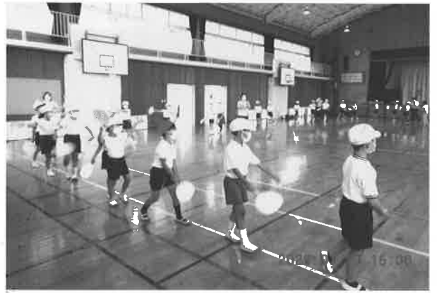
長東西小学校の長東音頭の練習