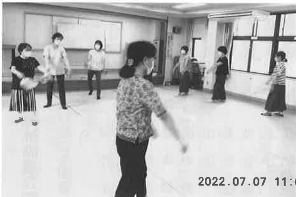
集会所での長東音頭の練習