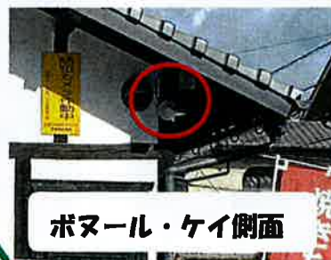
ポヌール・ケイ側面

1月20日 青崎一丁目町内会が広島市の補助金を活用して防犯カメラ2台を設置しました。犯罪の抑止力や捜査協力にも役立ちます。補助金申請については社協にご相談ください。