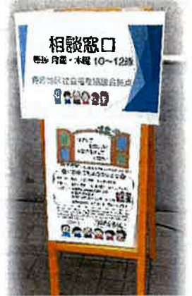
(公民館入口の案内看板)

内容によって地域のボランティアバンクや専門機関につなぐお手伝いをいたします。スタッフには守秘義務がありますので、安心してご相談ください。お待ちしております。