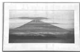
作品名「層雲」 伊豆半島天城高原より富士山 をバックに撮影。各高度層に掛 かる雲の情景を捉えた作品。

第74回広島県美展「写真 の部」で、平成24年(第64回) に初出展初入選以来10年、 夫婦それぞれ何回か入選し、 平成28年(第68回)に次い で2度目のご夫婦揃っての ご入選です。