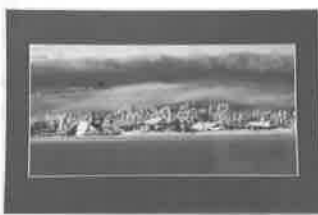
作品名「寒晴れの予感」 北広島町芸北で2月早朝、-8度 の寒い中、黒い雲に青い冬の空が 顔を出す瞬間を捉えた作品。