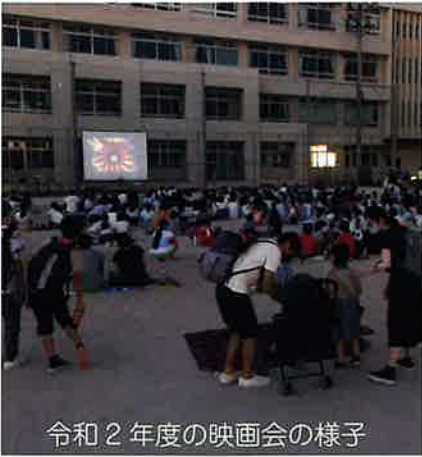
令和2年度の映画会の様子

午後7時30分から、白島小学校のグラウンドで三世代ふれあい交流事業の一環として映画会を計画していましたが、天候不順のため開催を延期しました。体育館での上映も検討されましたが、新型コロナウイルス感染拡大も重なり、屋内での実施は見送ることとなりました。準備にご協力いただいたPTA、青少協のみなさんに感謝申し上げます。上映は明るく笑えるように「トムとジェリー」が予定されていきました。次回の上映にご期待ください。