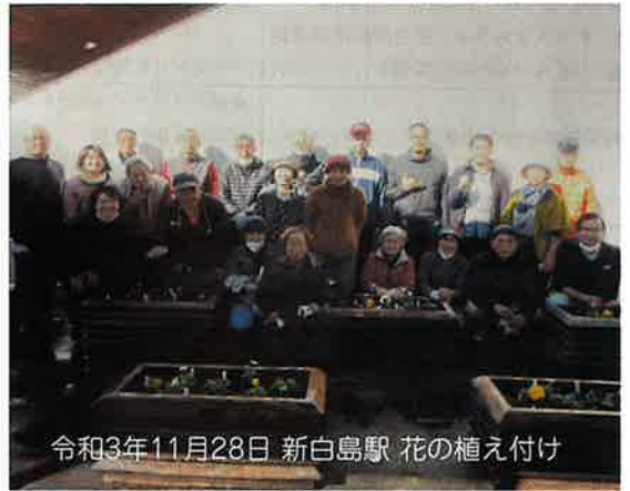
令和3年11月28日 新白島駅 花の植え付け