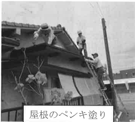
屋根のペンキ塗り

◎社会福祉協議会ボランティアバンク「はらみなみ」では、生活支援ボランティアを募集しています。ボランティア登録申込書は、社協相談窓口にありますのでご連絡ください。 社協相談窓口・ボランティアバンク「はらみなみ」 082(962)9898