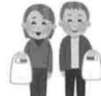
買い物・病院の 付き添い