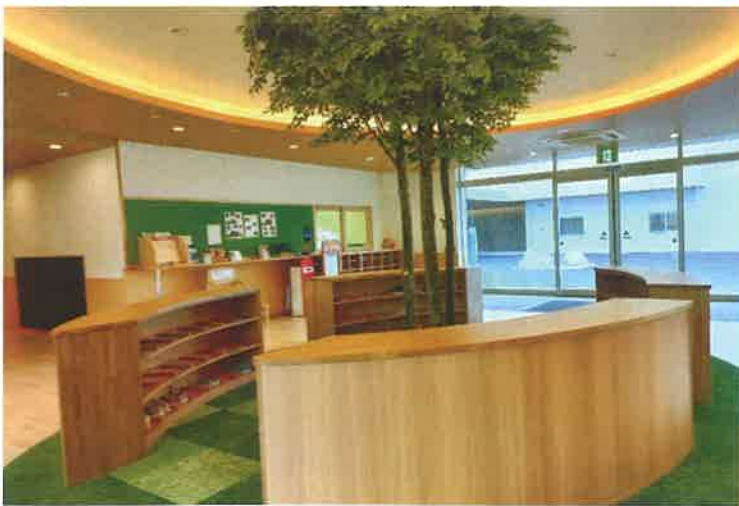
すてきな施設内風景