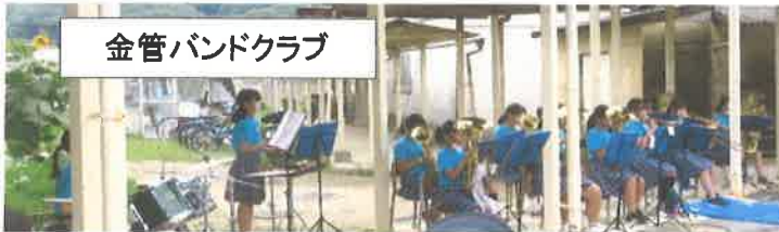
金管バンドクラブ