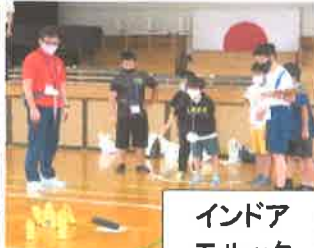
インドア モルック