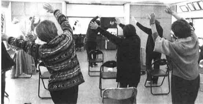
歌いながら同時に身体を動かすことで脳が活性化され認知症の予防効果があることから「はたかのうた」の普及に努めています。 為角会館にて

第 89 号 発行所 畑 賀 地 区 社 会 福 祉 協 議 会 〔畑賀福祉センター内〕 ☎ 847 - 6174