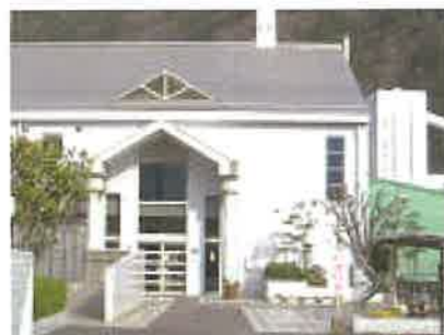
会場・可部福祉センター