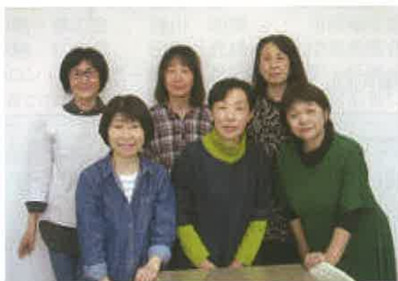
サロンの運営を支えている役員の方皆さん