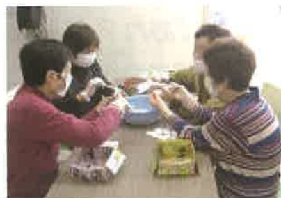
今回はゴキブリ団子作り

A. 毎回やるのは誕生会で、プレゼント付です。 脳トレゲーム、小物づくり、グラウンドゴルフ、ゴキブリ団子作り などです。