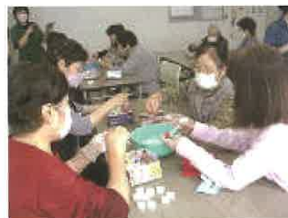
コロナ禍を考慮し、用意された材料 [タマネギ、ホウ酸、牛乳を混ぜたもの]を ボトルのキャップに詰めて完成！