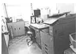
社協(ふれあい)事務所