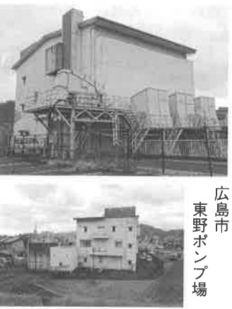
財官 宏年 広島市 東野ポンプ場

令和三年度の中筋四丁目の行事は新型コロナウイルス感染症防止のため全て中止といたしました。四月の総会は書面議決とし、春と秋の町内会清掃、レクリエーション行事のランチビュッフェ会は中止の決断を致しました。その代わりとして、年末にゴミ袋十枚を二束ずつ各家庭に配りました。令和四年度は、これまでの行事に加えて、ハザードマップの浸水表を基に、洪水時の避難場所の確認をしたいと思っています。この地域は大雨になれば浸水する可能性がある事の再認識を促していきます。また、それに合わせて大雨の時にこの地域の雨水を排出している東野雨水ポンプ場の見学ツアーを計画し、この地域の危険性を確認する勉強会を開く予定です。