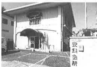
開設されている拠点風景

この取り組みの中で最も大事とされていることは、拠点に行くと「〇〇さんがいる」「ちよっと、こんなことがあつて困ったんだよ」という病院の待合室や、昔ながらの井戸端会議のようなことからお互いの困りごとが見つかり、近所内での「助けあい・支えあい・ふれあい」につながるかもしれないことです。