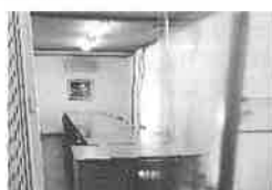
社協(ふれあい)会議室