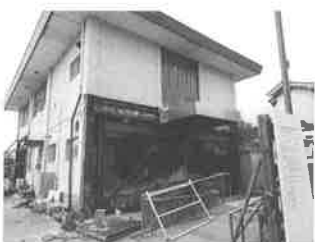
耐震補強工事写真