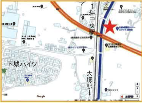
↑エブリイ沼田店周辺地図

バス停新設や運行経路変更には、国土交通省・広島市都市交通局・バスの運行業者等との協議を重ね、許認可が得られた後、新たな時刻表や運行経路図等を作成し、ご利用の皆様事前に配布するという作業があります。3月末までには、新しい時刻表をお手元にお届けできると思いますので、お楽しみにお待ちください。