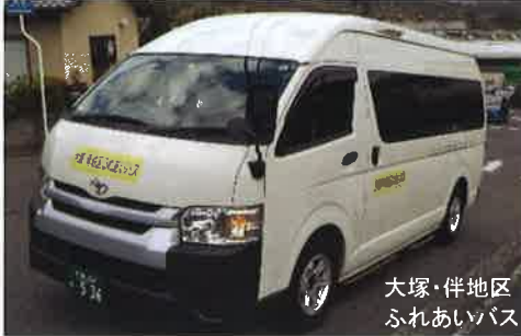
大塚・伴地区 ふれあいバス