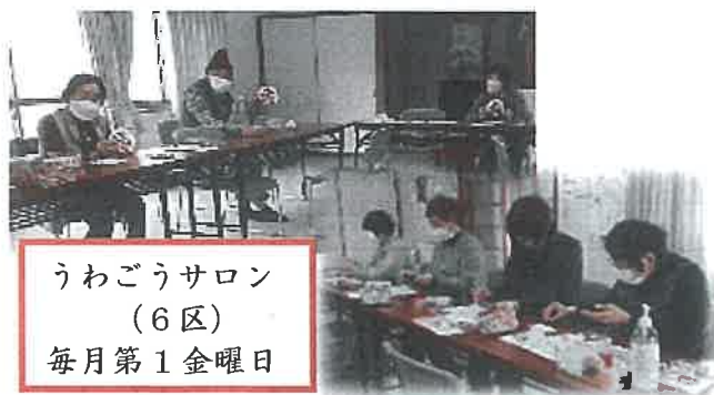
うわごうサロン (6区) 毎月第1金曜日