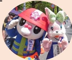
ひろピーとミミちゃん