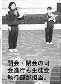
開会・閉会の司会進行も生徒会執行部が担当。

この活動は生徒会が主体となって生徒からボランティアを募り、グループ分けとリーダーを決め、それぞれで担当地区の地図を作成し、実際に歩いて清掃するコースを相談するなど、清掃方法も含めて綿密に計画を立てて当日に臨みました。一方、地域からは小学生と保護者、民生委員、児童委員、町内会、女性会、青少協、公衛協などの団体からボランティアが参加。3学区全体で260名の参加がありました。