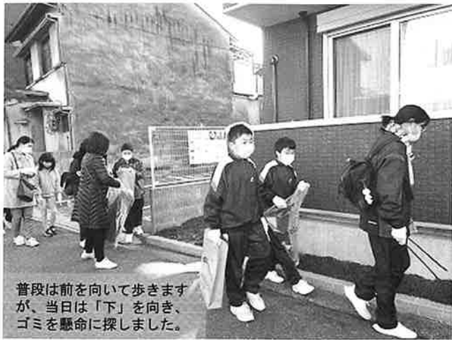
普段は前を向いて歩きますが、当日は「下」を向き、ゴミを懸命に探しました。

吉島中学校では、吉島中学校協力者会議を総括とし、生徒会を中心に『まちぐるみ「教育の絆」プロジェクト地域貢献事業』を立ち上げています。この一つに、生徒たちが地域住民とながり、地域で活躍できる貢献事業として、地域の清掃に取り組みんでおり、中島学区、吉島学区、吉島東学区の3つの地区に分かれて行われています。令和2年度は新型コロナウイルスの緊急事態宣言発令のために地域ボランティア清掃は中止となりましたが、感染者数が減少してきた昨年末は、12月24日にマスク着用厳守で開催されました。