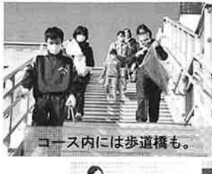
コース内には歩道橋も。