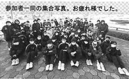
参加者一同の集合写真。お疲れ様でした。