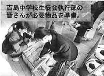
吉島中学校生徒会執行部の皆さんが必要物品を準備。