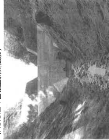
大町7号砂防堰堤における土砂撤去完了状況 (大町西2丁目)