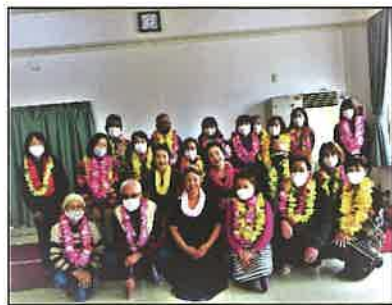
十二月定例会 十二月二十八日(火) (フラダンスのボランティアさん)