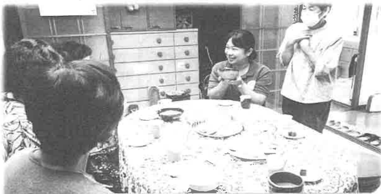
高齢者いきいき活動ポイント事業対象