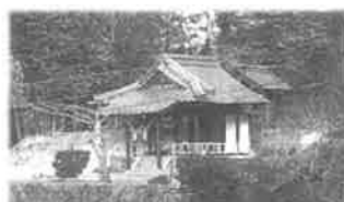
程落神社 (小野原上)