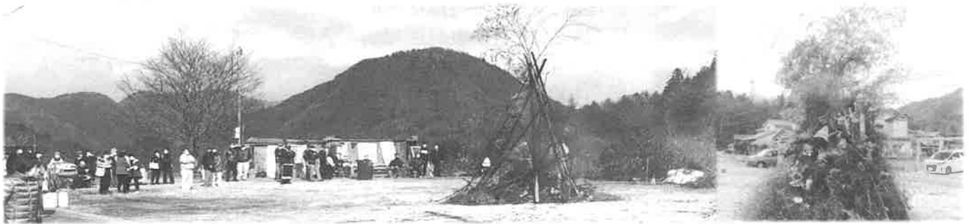
南が丘のどんど (コロナ禍につき飲食は中止でした。) 2022年1月9日