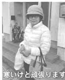
寒いけど頑張ります 高陽台Mさん