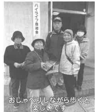
おしゃべりしながら歩くと 楽しいです 岩の上第一区の皆さん