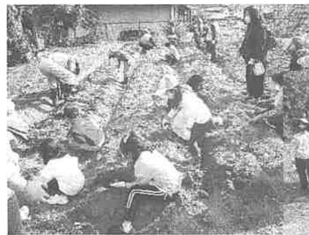
亀山南児童館さつまいも収穫祭