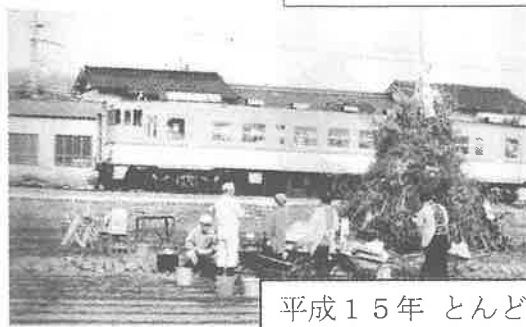
平成15年 とんどの準備