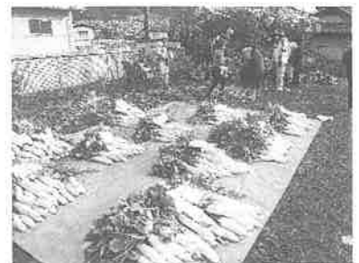
収穫した大根ともみじ饅頭を一人暮らしに配布