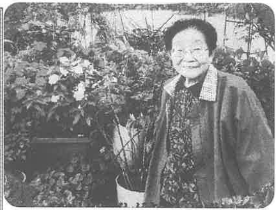
苗や土を毎回種やさんで購入して育てている花々