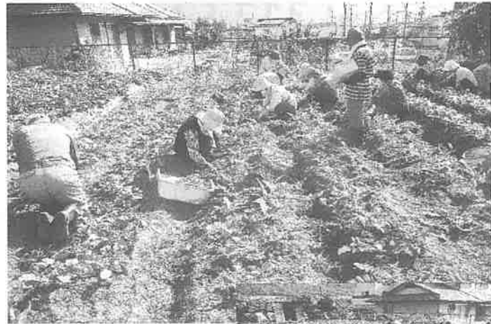
草取りと大根間引き