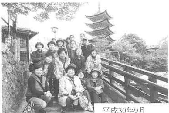
平成30年9月 宮島観光