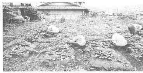
さつまいも草取りと付近の清掃