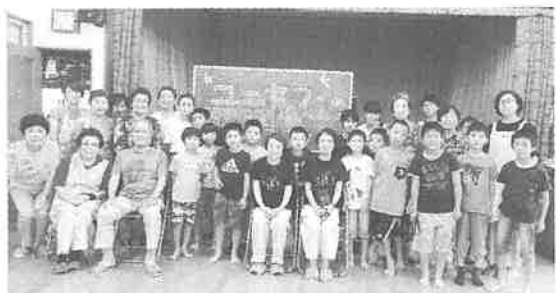
平成31年7月 子ども会との交流