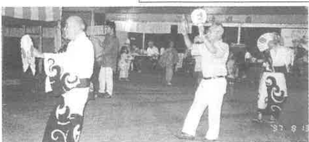
平成9年 揃いのゆかたで盆踊り