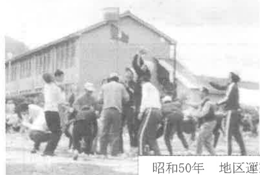
昭和50年 地区運動会 旧高宮中学校 (現エブリイ)