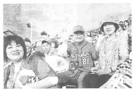
平成27年8月 野球観戦 可部線に乗って