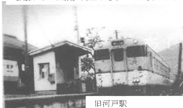
旧河戸駅 (昭和31年12月開業)