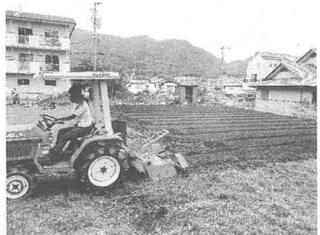
畑作り まずは草取りと畝作り