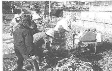
大根を収穫して一人暮らし高齢者にお届けします