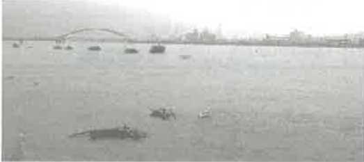
水して河敷の水没した太田川 ※後方に安芸大橋 (8月14日 撮影)