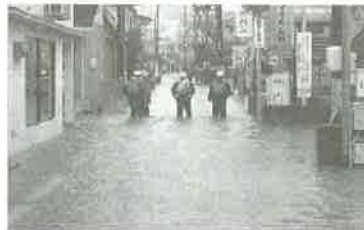
膝下まで浸水した長東商店街と橋の欄干まで増水する新安川 (新芦田屋橋付近)