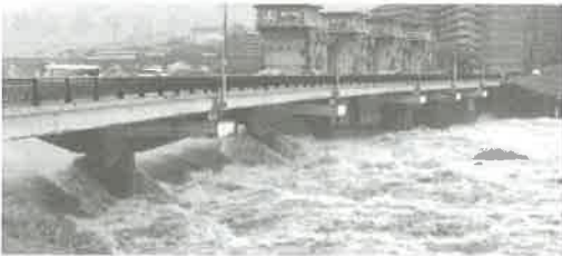
水門を全開にして濁流を放水する大芝水門 (広島市東区牛田)