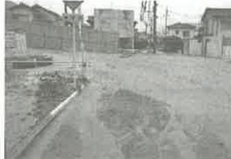
8.20豪雨災害を彷彿とさせる土砂の流入した八木用水 (安佐南区緑井8丁目)