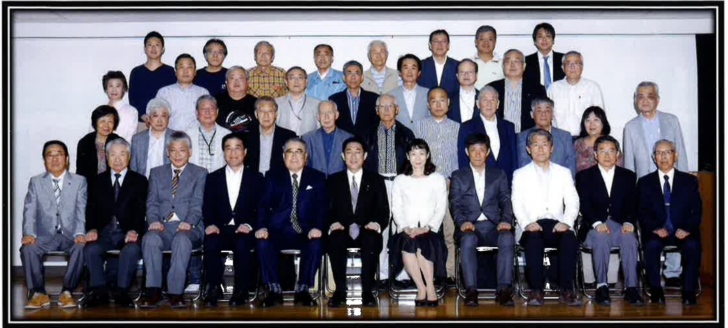
2017年5月13日@宇品老人いこいの家「平成29年度宇品西地区社会福祉協議会理事総会」 顧問や来賓、理事らとの記念撮影 前列の右から6人目が岸田総理

宇品西地区で開催された地域行事に岸田文雄内閣総理大臣(当時・外務大臣、自民党政務調査会長)にお越しいただきました。これからも宇品西地区をよろしくお願いします。