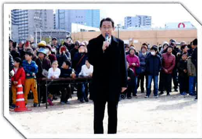
2018年1月14日@ザウルスゆめ公園 「2018年宇品西とんど祭り」 来賓代表としてご挨拶をされる岸田総理