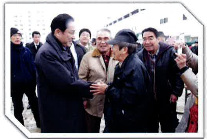
2017年1月15日@ザウルスゆめ公園「2017年宇品西とんど祭り」地域住民と挨拶を交わす岸田総理