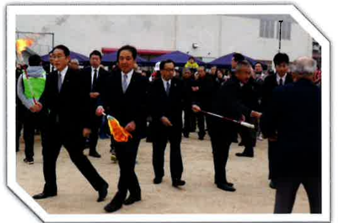
2020年1月12日@ザウルスゆめ公園 「2020年宇品西とんど祭り」 とんどに火を灯す岸田総理と中原県議会議員ら