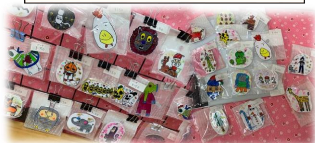
作業所の自主製品