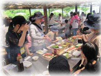
障害児親子教室 「ちやいちやいくらぶ」