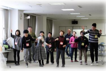
東区障がい青年のつどい 「さんsunくらぶ」