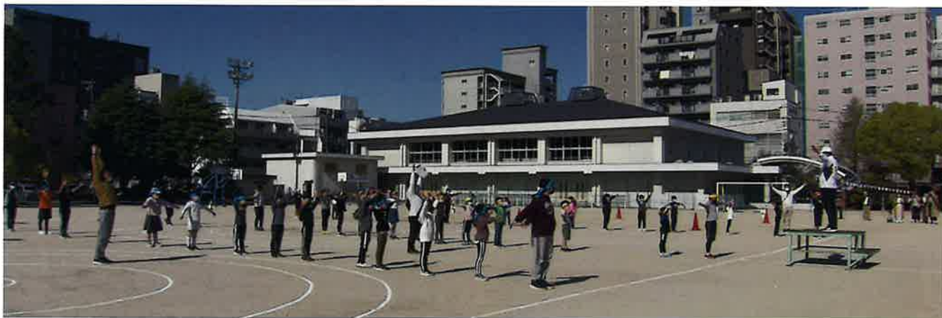
指導員に見習って準備体操、手の位置がちがう子も！