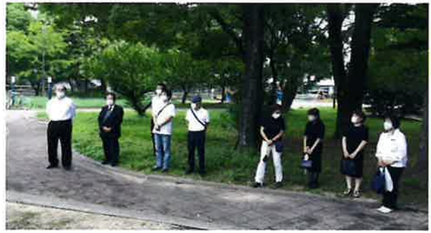
参列者は役員のみ

7月17日（土）、舟入(白鳩)公園原爆死没者慰霊式が執り行われました。新型コロナウイルス感染拡大の中での開催でもあり、役員だけの慰霊式となりました。前年に引き続いて寂しい慰霊式となりましたが、継続して実施することが死没者の霊を慰めることとなるではとの思いで実施されました。