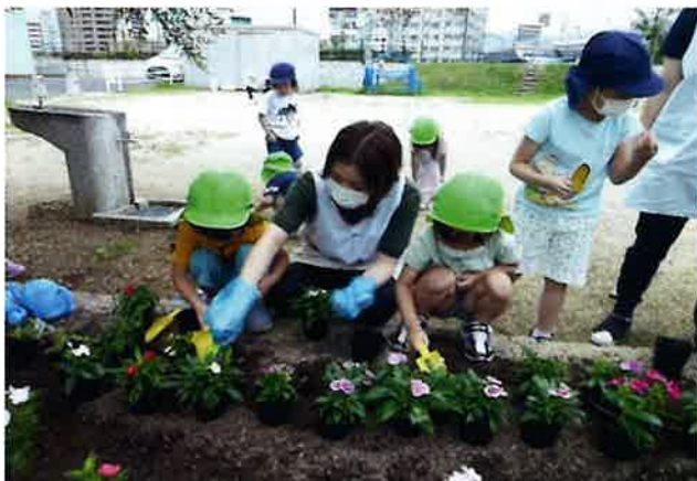
かがやき保育園の園児達