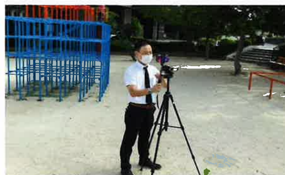
児童のもとへリモート配信「上手く届くかな」