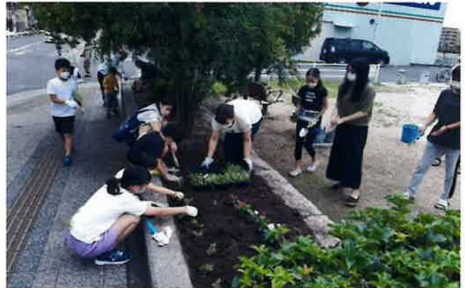
舟入本町西子ども会の皆さん

3月にも花の植栽を行っていますが、新型コロナウイルス感染拡大により活動の場が制約された子ども達にとって、心を癒されたひと時ではなかったかと思っています。後日、町内の「かがやき保育園」の園児達も花の植栽を行い、花壇は花一杯になりました。園児たちも大変喜んで花を植えたとのことでした。