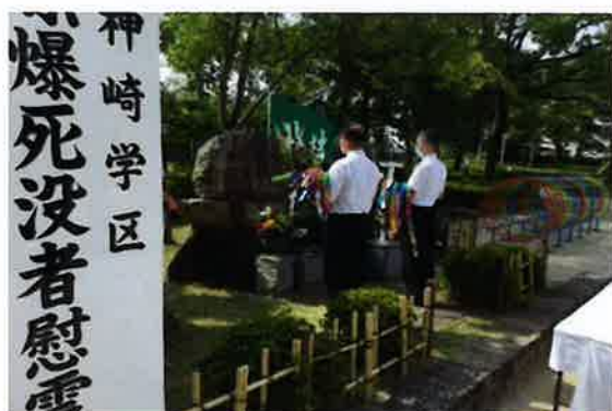
折鶴を捧げる神崎小学校の校長先生と教頭先生