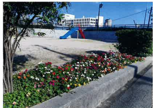
厳しい夏を乗り越えて咲いています