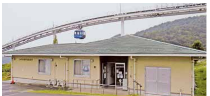
スカイレールタウンと地区社協拠点があるみどり坂学区集会所