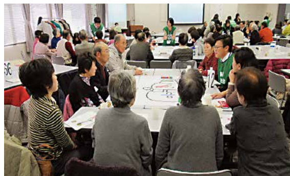
▲平成30年度ボランティアグループ研修会 西日本豪雨災害の情報交換の様子(参加者:ボランティアグループと地区社協関係他 142名)

また、安芸区ボランティアセンターには、手話や点字、音訳、施設等への訪問活動など行うボランティアグループが51団体登録しています。登録グループで、「安芸区ボランティアグループ連絡会」を運営し、年8回、各グループの代表が集い、情報交換や、交流会・研修会を企画し実施しています。