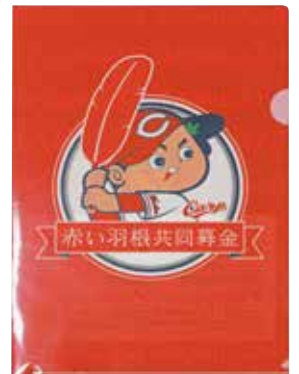
赤い羽根×カーブ コラボクリアファイル 2021