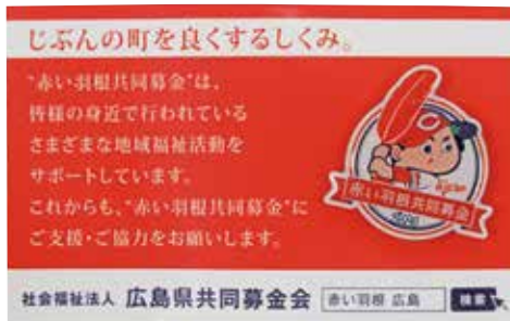
赤い羽根×カーブ コラボピンバッジ 2021

皆様からいただいた募金は、高齢者や子育てサロン等の身近な地区社協活動や災害ボランティアなど被災地を応援するために活用されます。皆様のご協力をお願いいたします。