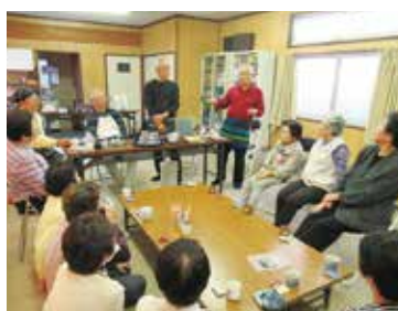
広島市シニア大学グループ 安芸区の集い

の活動や、地元のサロンの手伝い、福祉サービス利用援助事業「かけはし」の支援員として活動している方もおられます。