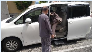
付き添い送迎支援の様子(イメージ)

コロナワクチン接種の予約に困っている方（電話がつかない、パソコン・スマホが使えない、かかりつけ医がない）、および足腰が不自由でコロナワクチン接種会場に行けないことから接種を断念している方を支援するため、毘沙門台学区社協では、接種の代行予約および接種会場への行き帰りのための付添送迎サービスを開始しました。