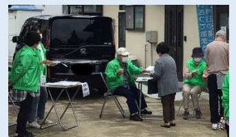
ウォーキング会でのチラシ配布の様子

紹介した取組について、具体的な方法などをお知りになりたい場合は、 各区社会福祉協議会までお問い合わせください!