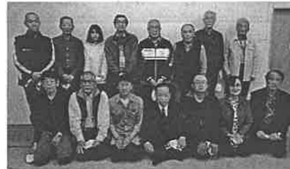
新役員の方、よろしくお願ひします

令和3年度行事では、8月7日に「口田盆踊りの夕べ」、9月19日「敬老会」、10月11日に口田学区町民運動会、10月30日「福祉まつり」、11月12日に防災訓練を予定していますが、コロナ感染拡大の状況を見ながら開催の可否を判断してまいります。収支決算書(別表1)、収支予算書(別表2)、役員名簿(別表3)です。