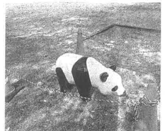
パンダはまだペンキ塗り立てのため、ロープで囲まれていました。(5月2日)