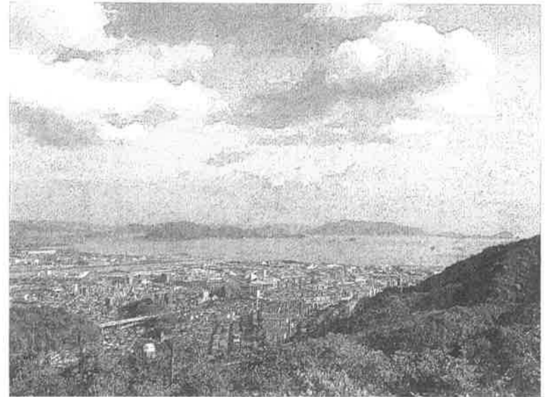
鬼ヶ城山山頂からは、鈴が峰町を一望できます。