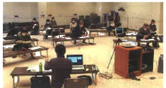
会場はフィジカルディスタンスをしっかりと！