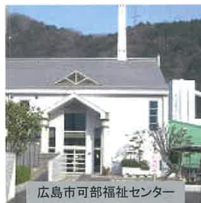
広島市可部福祉センター

※内容によっては、行政や三入・可部地域包括支援センターとも連携して、住民の皆さんの困りごとに対応しています。