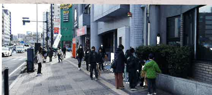
路上のゴミ収集の風景