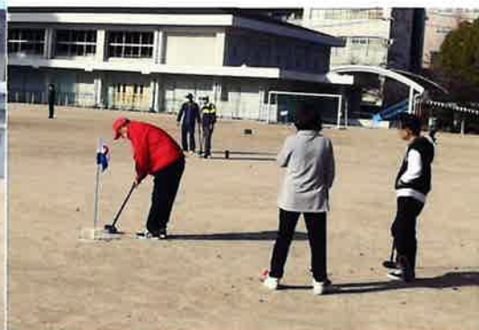
この距離なら入るかな？