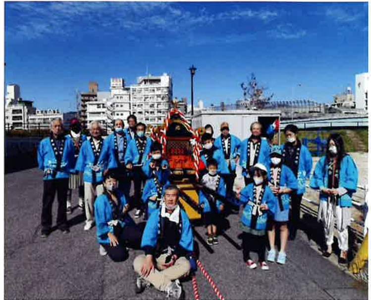
役員だけで曳いて廻ろうと思っていましたが、子ども達も参加

「子ども達には、これも思い出の1ページとなるのでは」との思いがよぎる祭りとなりました。