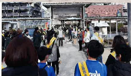
神崎小学校出発前