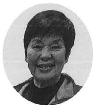
連合女性会 (吉島西2丁目)

今年は、たくさんの行事に参加できることを楽しみに、皆が一丸となり、頑張っていきたいと思います。笑える時代は、必ずやってくると信じて…。