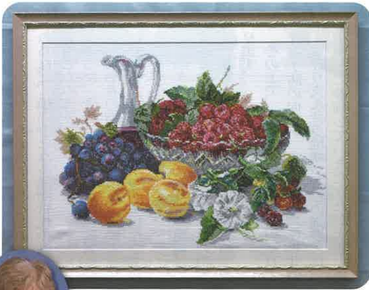
工芸品 クロス刺繍 ワイン&季節の果実 作者 12区 亀井ヒロコ様