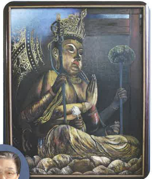
油絵 不容絹索観音菩薩坐像 作者 8区 向井弘様