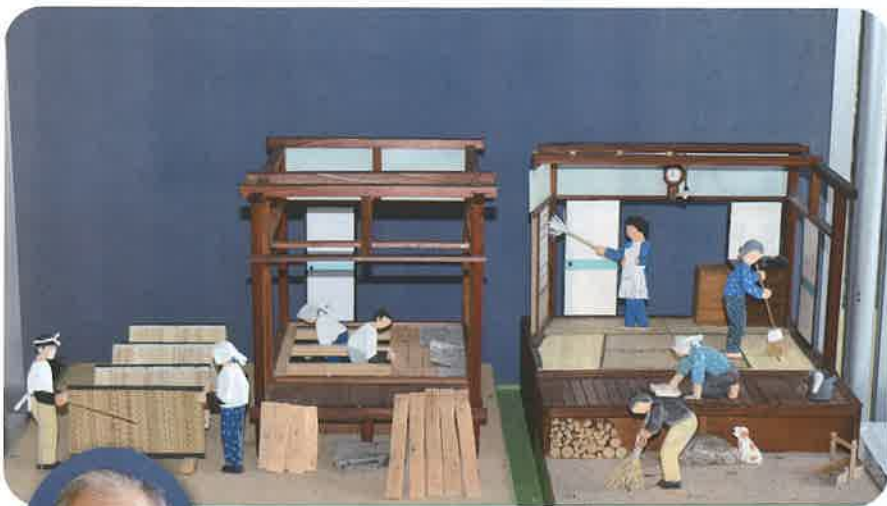
工芸品 昭和の大掃除風景