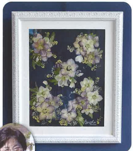
押し花 クリスマスローズ 作者 5区 鈴木清子様