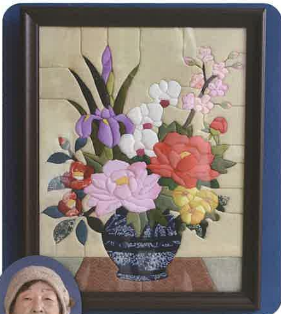
工芸品 きめこみ 作者 15区 橋本澄江様