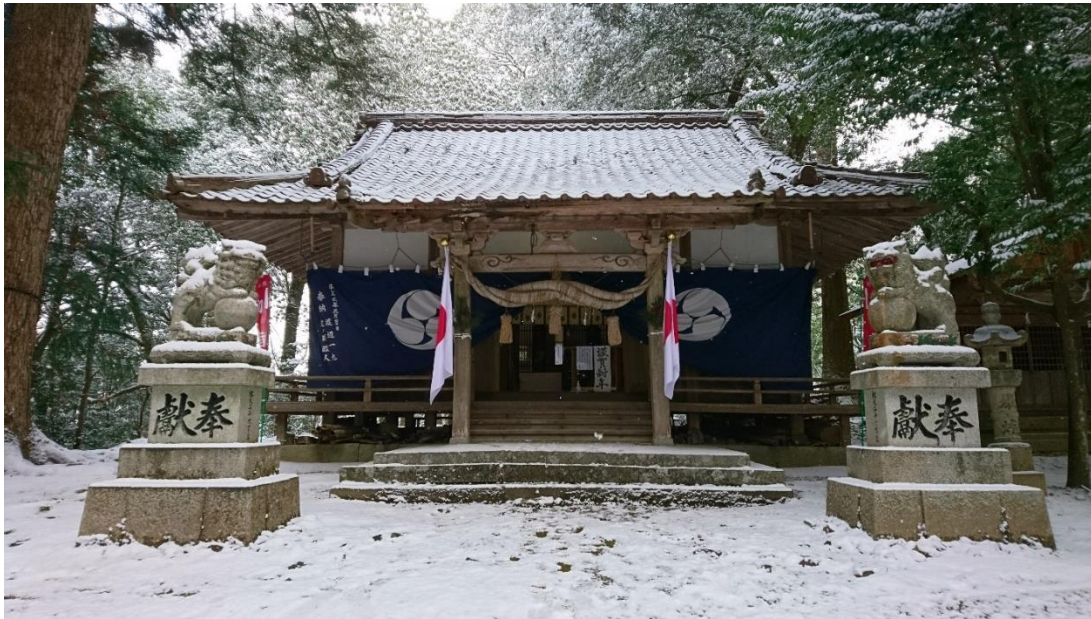
2021年元旦 うっすらと雪化粧をした平藪神社