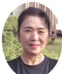
高齢者行事部会長