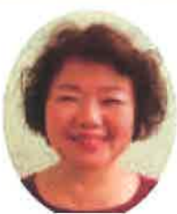
地域福祉推進委員