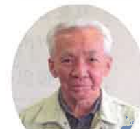
救急医療情報キット