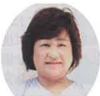
子育てサロン主宰