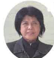
子育てサロン支援