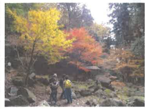
水谷峡のもみじ