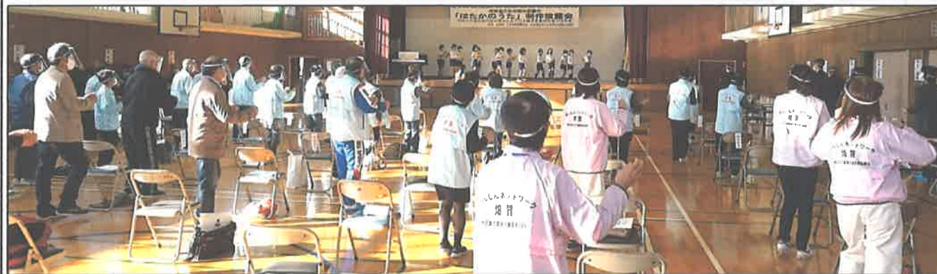
ステージでは畑賀小4年生（内15名）が体操を披露してくれ、会場全員と一緒に体操をしました。