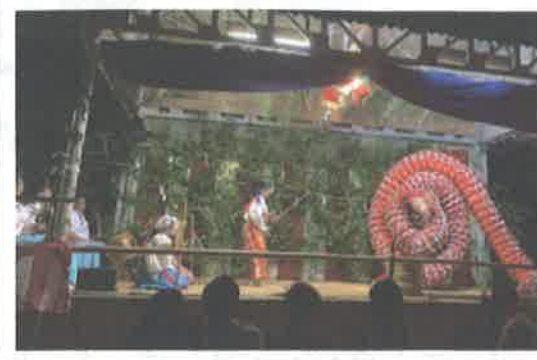
中須賀神社秋祭り 神楽奉納