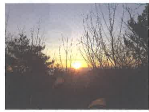
呉婆宇山の初日の出