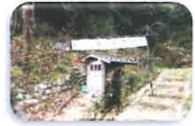
第3水車 H26年年10月完成