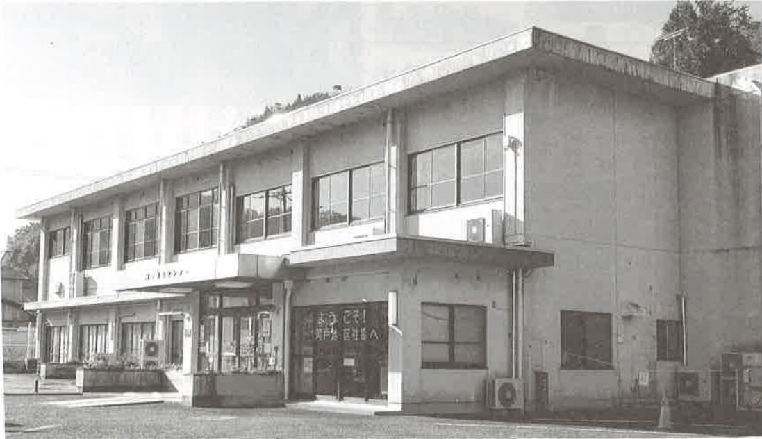
阿戸福祉センター (2020年11月撮影)

阿戸町の世帯・人口 世帯数 950戸 人口 2,030人 男 986人 女 1,044人 (令和2年10月末現在)