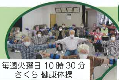
毎週火曜日 10時30分 さくら 健康体操

会場によって参加条件が異なりますので、社協事務局または包括センターにお問い合わせください。