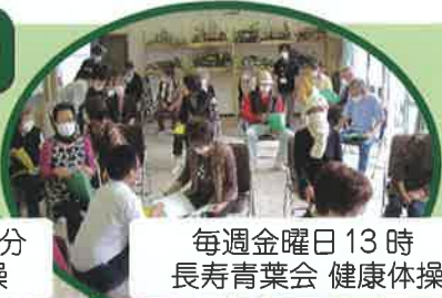
毎週金曜日 13時 長寿青葉会 健康体操