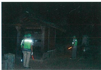
夜間の見守り活動