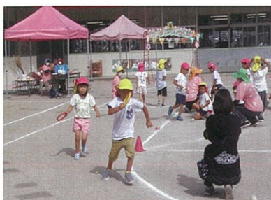
一生懸命走ったぞ！！