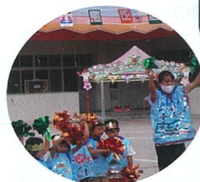
先生たちもがんばって！