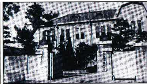
(写真右)女子短期大学発足当時の正門(1950年)