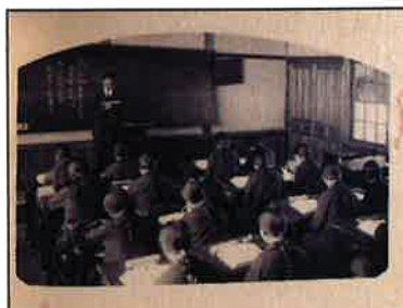
(写真左)広島女子専門学校にて授業を受ける女子学生(1932年)